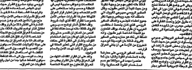
مجلس الامن يدين العراق ويطلبه بالتراجع

نيويورك - قال مجلس الأمن في جنيف امس ان مجلسه قد وافق على مشروع قرار يدين العراق في انتهاك واضح للميثاق الذي يحدد قواعد العمل في مجلس الأمن. وقال المجلس ان القرار يدين العراق لانه لم يمتثل لقرار مجلس الأمن رقم 687 الذي يوجب على العراق التخلي عن أسلحته الكيميائية والبيولوجية والذرية. وقال المجلس ان القرار يدين العراق لانه لم يمتثل لقرار مجلس الأمن رقم 688 الذي يوجب على العراق السماح للفقراء العراقيين بالفرار من العراق. وقال المجلس ان القرار يدين العراق لانه لم يمتثل لقرار مجلس الأمن رقم 689 الذي يوجب على العراق السماح للفقراء العراقيين بالفرار من العراق.